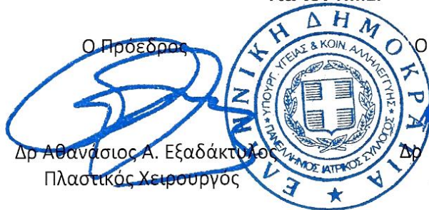
Δρ Αθανάσιος Α. Εξαδάκτυλος Πλαστικός Χειρουργός